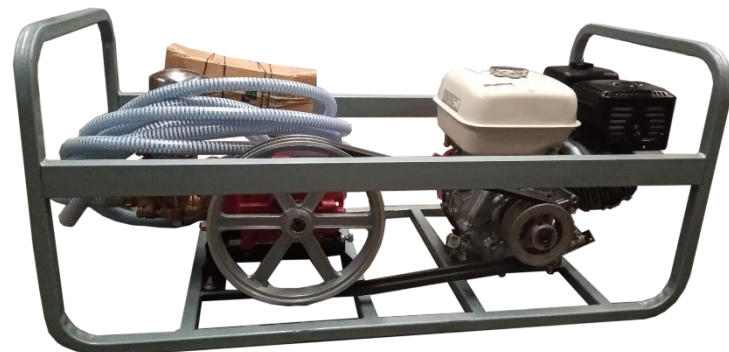
PARIHUELAMARR CON MOTOR GX200 VISTA TRASERA