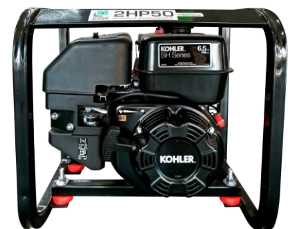
Motor KOHLER SH265 6.5HP