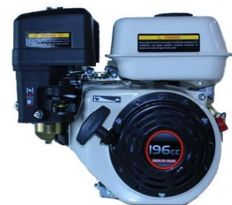
G200F Powered by MARR