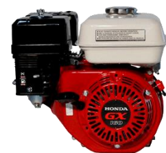
Motor HONDA GX160