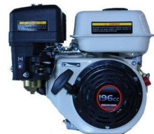
Motor MARR G200F 6.5 HP