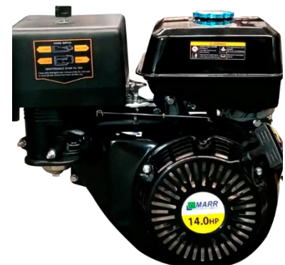
Motor MARR HL420 Gasolina