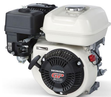
Motor HONDA GP200