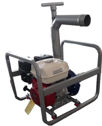
MOTOBOMBA 198 2"x2"

Ensamblada con motor Honda GX270 9hp, 4 tiempos a gasolina.