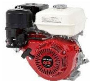
GX270 QX power by Honda