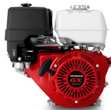
GX390 power by Honda