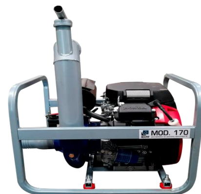
MOTOBOMBA 170 4"x3"

Ensamblada con motor Honda GX630 de 23 HP de 4 tiempos a gasolina