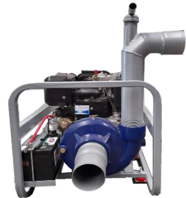
MBOMBA MOD 208

Ensamblada con motor Marr diésel 9 HP (HL186FAE)