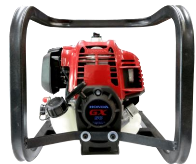
MOTOR HONDA GX50