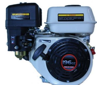
G200F Powered by HONDA