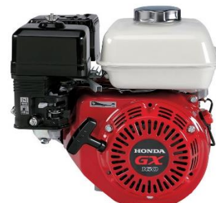
GX160 Powered by HONDA