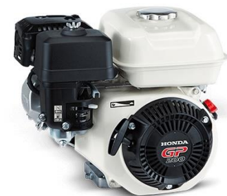
GP200 Powered by HONDA