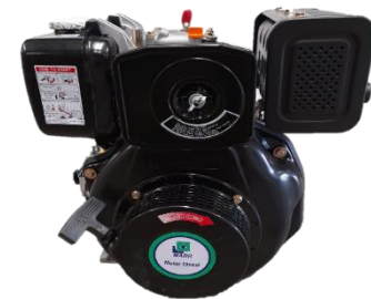
HL178FA Powered by MARR