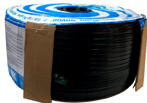
Cintilla Novodrip Laberinto

Ayuda a mejorar el rendimiento, la eficiencia en el uso del agua y la calidad de los cultivos. Es la línea de goteo de laberinto continuo ideal para espacios reducidos entre cultivos de hortalizas y cultivos de flores. La distancia entre los puntos de goteo y el bajo caudal garantizan un excelente rendimiento incluso en suelos muy arenosos.