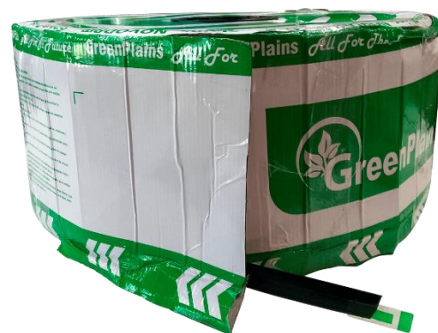
Cintilla Novodrip Pastilla

El emisor VIMI cuenta con una amplia sección transversal de flujo y extra grande área de filtración para un rendimiento eficaz y eficiente y resistencia a la obstrucción. Incluye el gotero plano ultra compacto que genera una pérdida de carga de casi 0, en el equipo de instalación. El diseño minimiza la pérdida por fricción a través de su diseño pequeño y su trayectoria de flujo de ingeniería única. Para la presentación de 8 mm, tiene una durabilidad estimada de 5 a 6 años enterrada. Considerando una buena limpieza y cuidado.